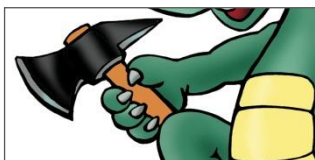
Soutěžní kupón č. 3